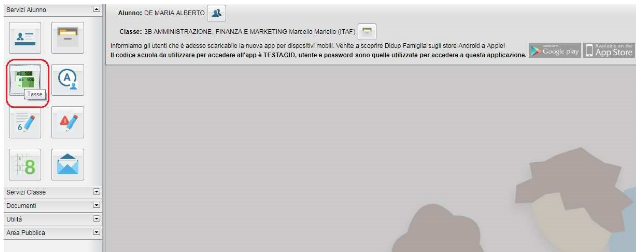
(accesso ai servizi di pagamento)

Il servizio di pagamento delle tasse e dei contributi scolastici è integrato all'interno di Scuolanext - Famiglia, ed è richiamabile tramite il menù dei Servizi dell'Alunno .