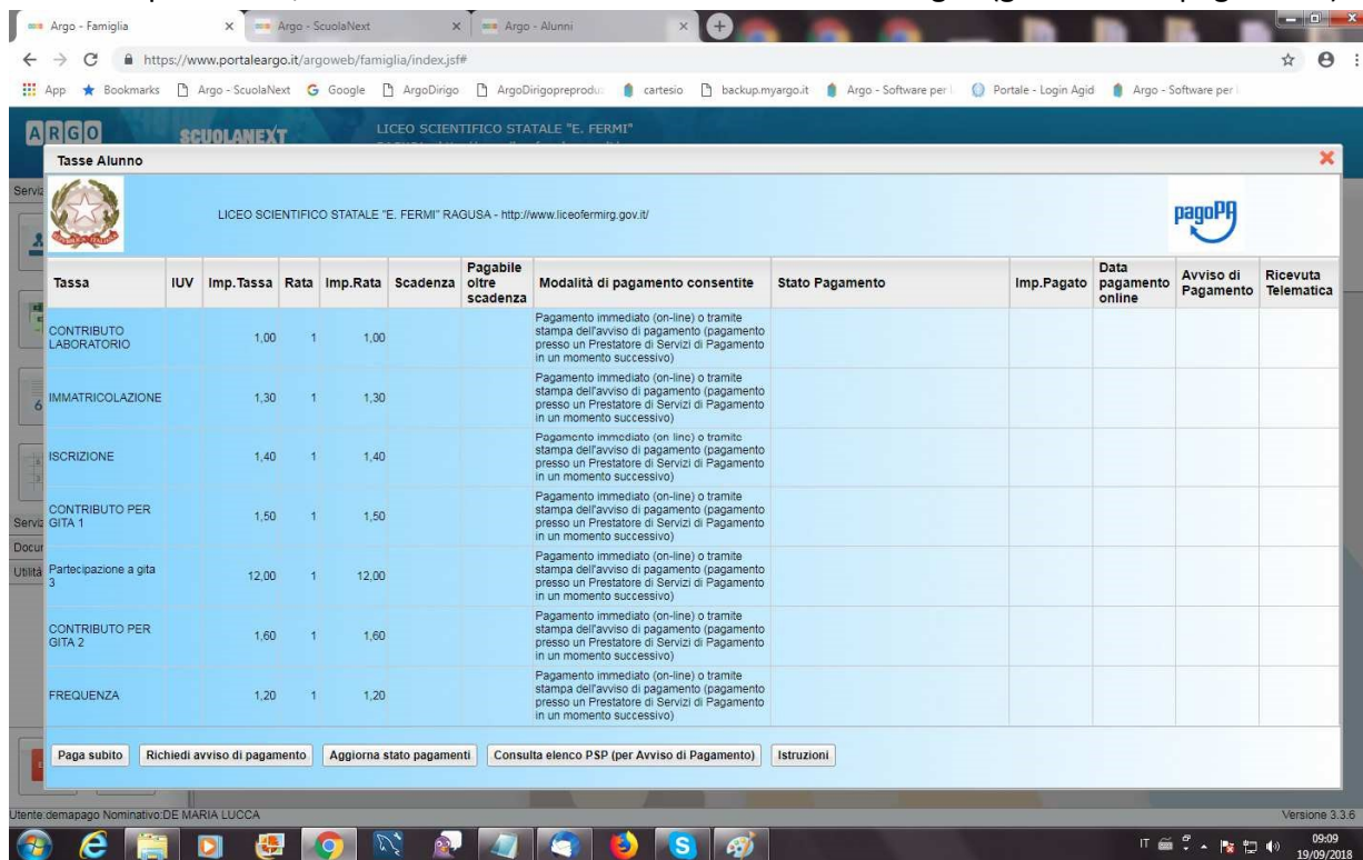
(schermata dell'elenco tasse dell'alunno)

Selezionata la procedura, si accede all'elenco delle tasse a carico del figlio (gestione dei pagamenti).